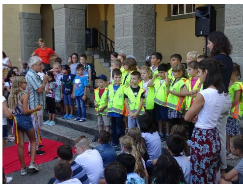
Begrüssung der 1. Klässler durch den Schulleiter